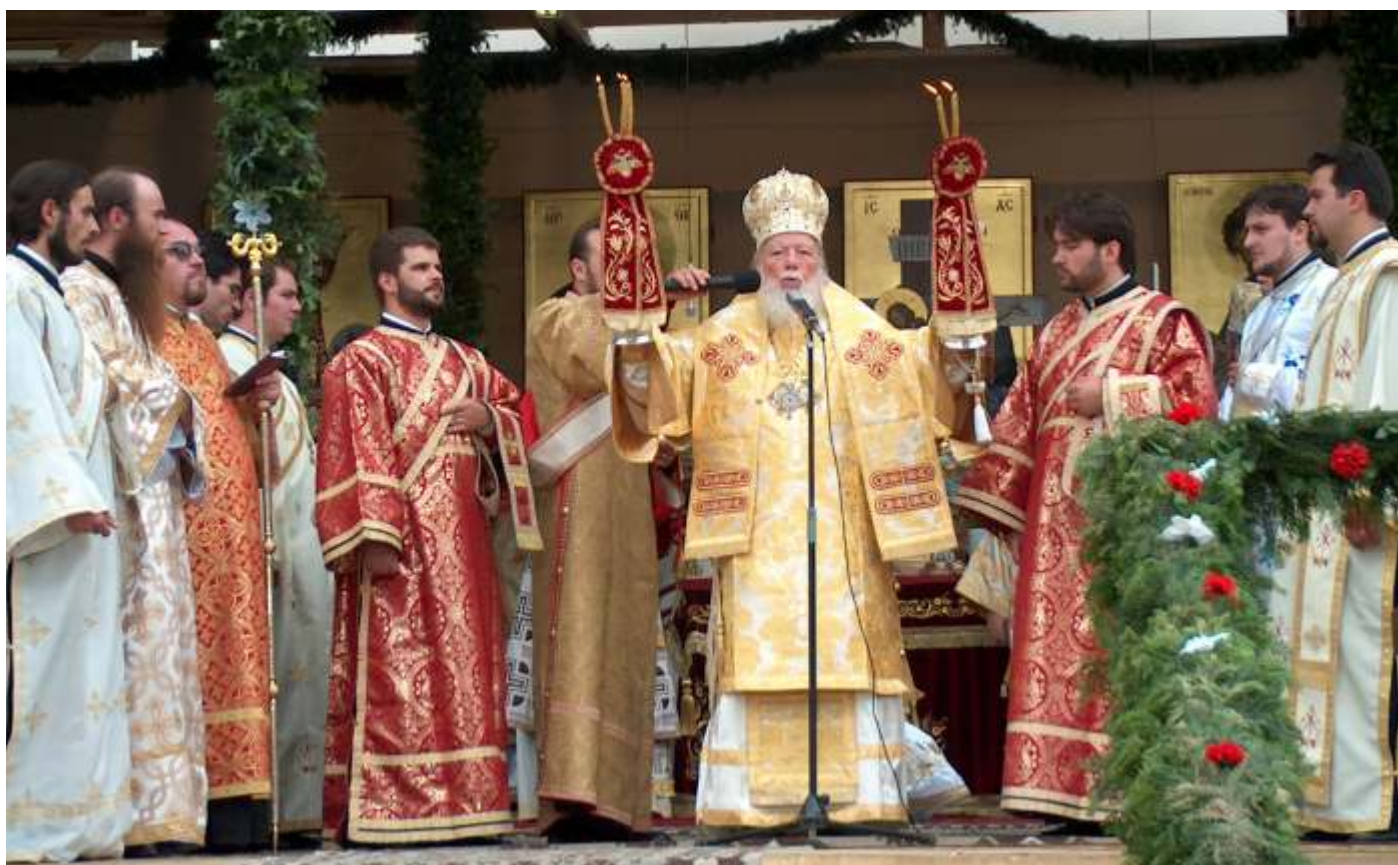
Prea Fericitul Părinte Teoctist, Patriarhul Bisericii Ortodoxe Române Sfânta Liturghie din 2 iulie 2004 – prăznuirea Sfântului Ștefan cel Mare

A început Dumnezeiasca Liturghie de la Ștefan 500.