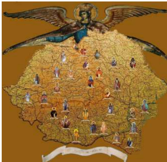
Harta cu icoanele sfinților români dăruită mănăstirii Putna de tinerii din A.S.C.O.R. și L.T.C.O.R.