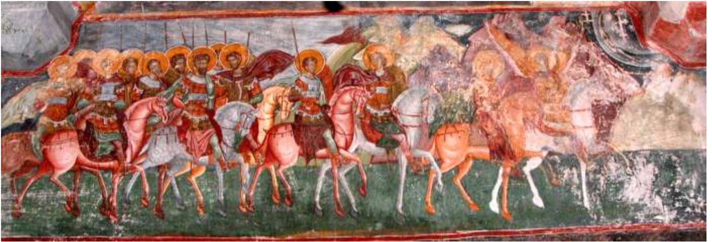
Cavalcada de la Pătrăuți