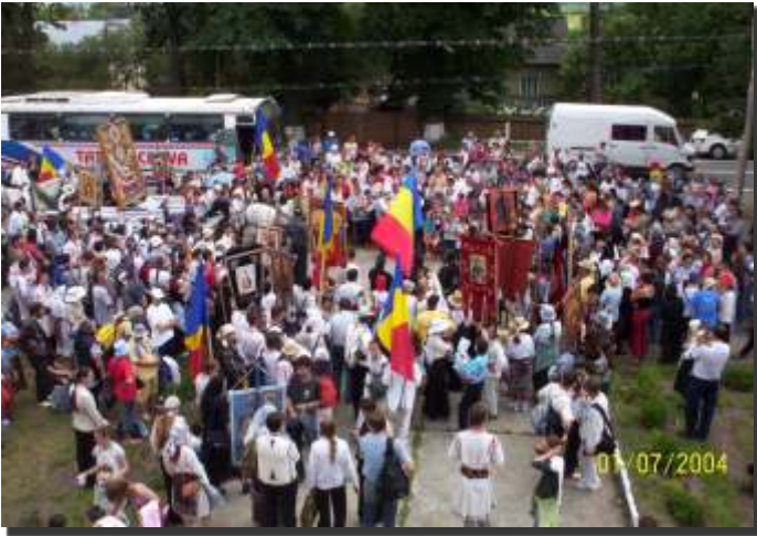
ora 15 Pelerinii sunt întâmpinați de locuitorii din Gălănești

Un om simplu din Bucovina, care ne-a fost gazdă, ne-a spus: „Măi copii, sunt fericit și uimit să constat că țara asta nu-i chiar pierdută dacă niște tineri au fost capabili de un asemenea gest. Să dea Bunul Dumnezeu să ne întâlnim într-un loc mai bun și mai drept!”