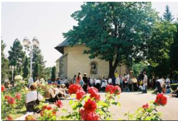
ora 9 Mănăstirea Bogdana — Rădăuți Închinarea la moaștele Sfântului Ierarh Leontie