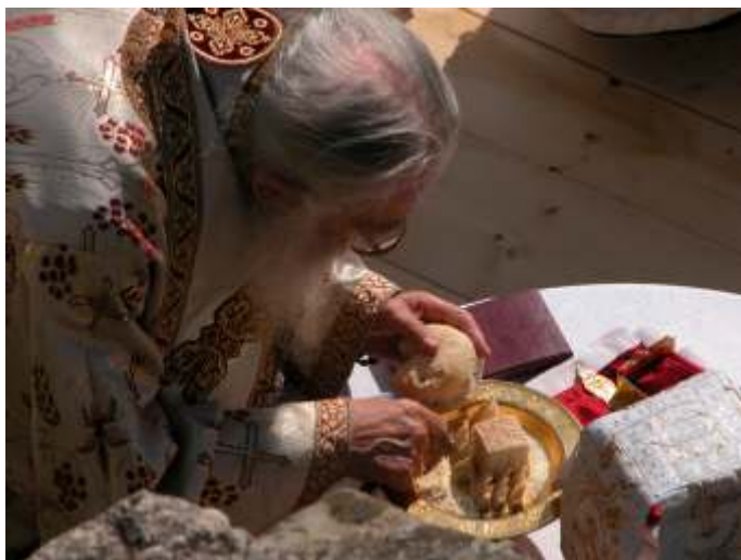
PS Gherasim Putneanul slujind Dumnezeiasca Proscomidie

bătrânele ziduri. De câte ori a răsunat în 500 de ani?!