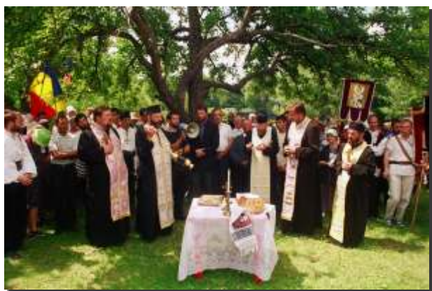
ora 12 Primirea pelerinilor în satul Horodnic

„Cerurile spun slava lui Dumnezeu și facerea mâinilor lui o vestește tăria.” Să îți dai seama că toate sunt creația lui Dumnezeu, că El este în toate, pretutindeni. Este poate mai greu să faci acest lucru când trăiești înconjurat de blocuri și în zgomot de claxoane. Dar lucrul acesta devine mai limpede când ești pe o pajiște, în mijlocul naturii făcute de Domnul, unde, la umbra unor copaci, slujitorii Săi Îi înalță rugăciuni.