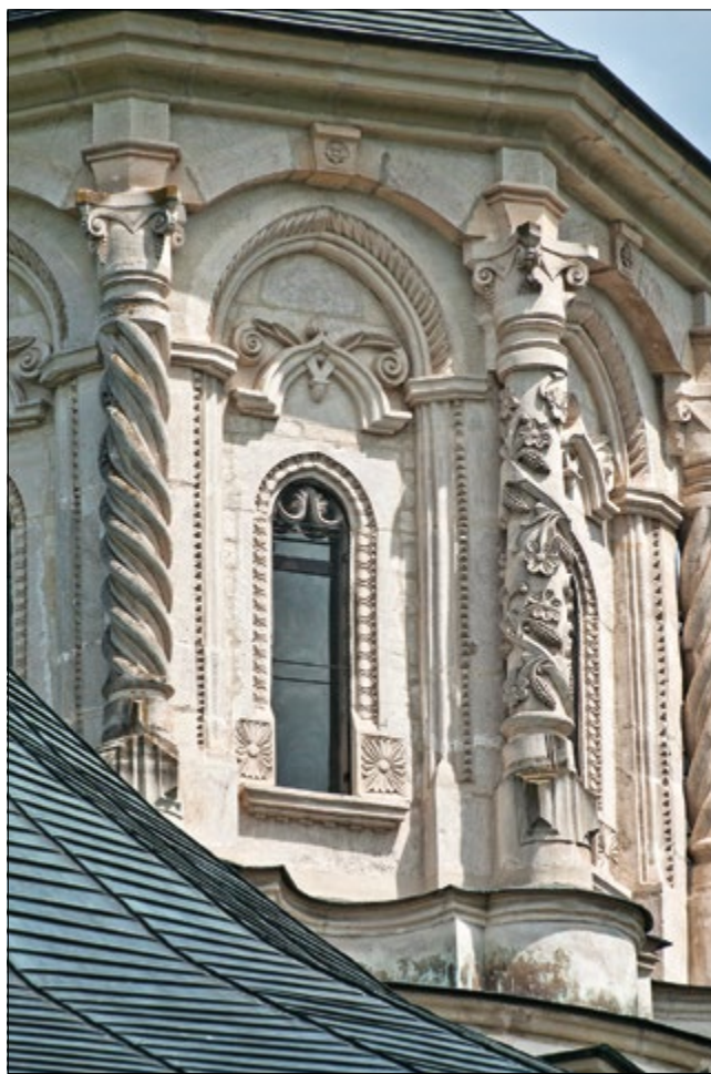
▲ Turla mănăstirii, refăcută de Sfântul Iacob Putneanul după distrugerea ei în urma cutremurului din 1739. Detaliu.