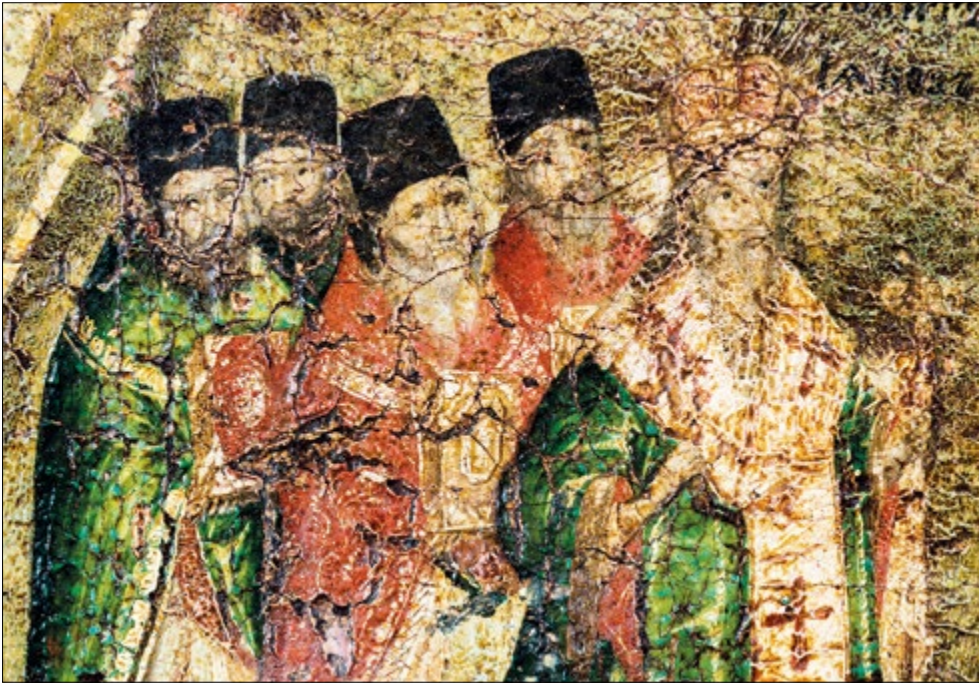
▲ Sfântul Iacob și principalii colaboratori la rectorirea Mănăstirii Putna. Detaliu din tabloul realizat după lucrările de înnoire. Circa 1761–1768.