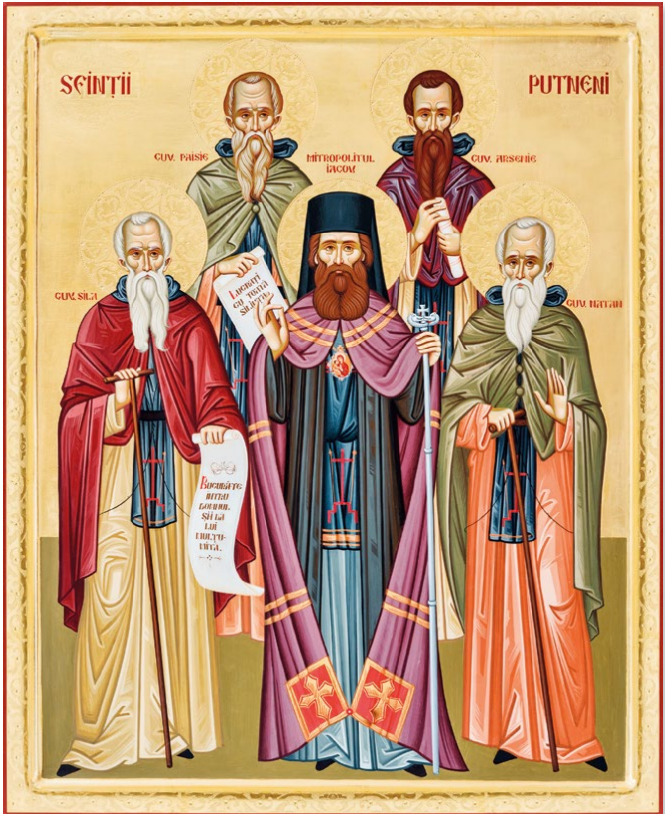
▲ Sfântul Ierarh Iacob Putneanul, Mitropolitul Moldovei, și ucenicii săi, Cuvioșii Sila, Paisie, Natan și Arsenie.