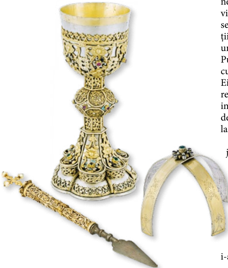
▼ Copie (circa 1757), potir de la Sfântul Sila (1757) și steluță (circa 1757).

în cuvintele Sfântului Iacob: mănăstirea este „maica și clironomia mea”, după cum scrie în testamentul său, în 1761–1762. Mănăstirea este maica duhovnicească în care s-a format și căreia îi datorează sporierea duhovnicească. „Clironomie” înseamnă că mănăstirea îi este moștenitoare, adică toate ostenele sale duhovnicești și materiale se adaugă la zestrea mănăstirii,