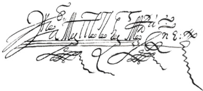
▲ Inelul cu sigiliul Mitropolitului Iacob Putneanul și semnătura sa de pe actul de blestem al văcăritului.

În 1749, Sfântul Iacob luase parte la legarea prin blestem a văcăritului de către toți ierarhii moldoveni.