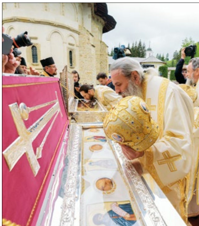
▲ Înaltpreasfințitul Părinte Teofan, Mitropolitul Moldovei și Bucovinei, se închină la moaștele Sfinților Sila, Paisie și Natan. Moment din timpul Proclamării solemne a canonizării Sfinților putneni, Mănăstirea Putna, 14 mai 2017.

ca al doilea mare ctitor și ca un mare părinte duhovnicesc al ei.