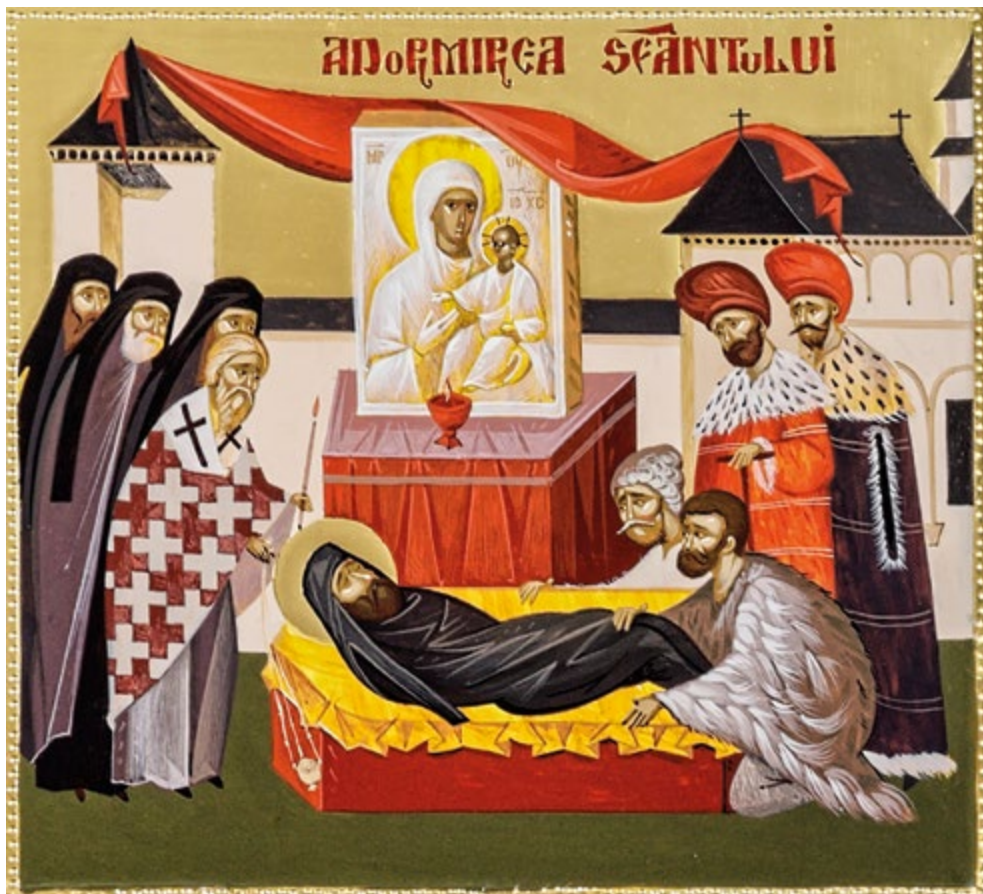
▲ Scenă din icoana de la baldachinul cu racla moaștelor Sfântului Iacob.

a răului, a căutat îndreptarea domnului care îl izgonise, practic, din scaun. A reușit aceasta, astfel încât și Ioan Teodor Callimachi și, apoi, fiul său, Grigore Callimachi, devenit domn, îl vor sprijini în chivernisirea mănăstirii și la înnoirea ei.