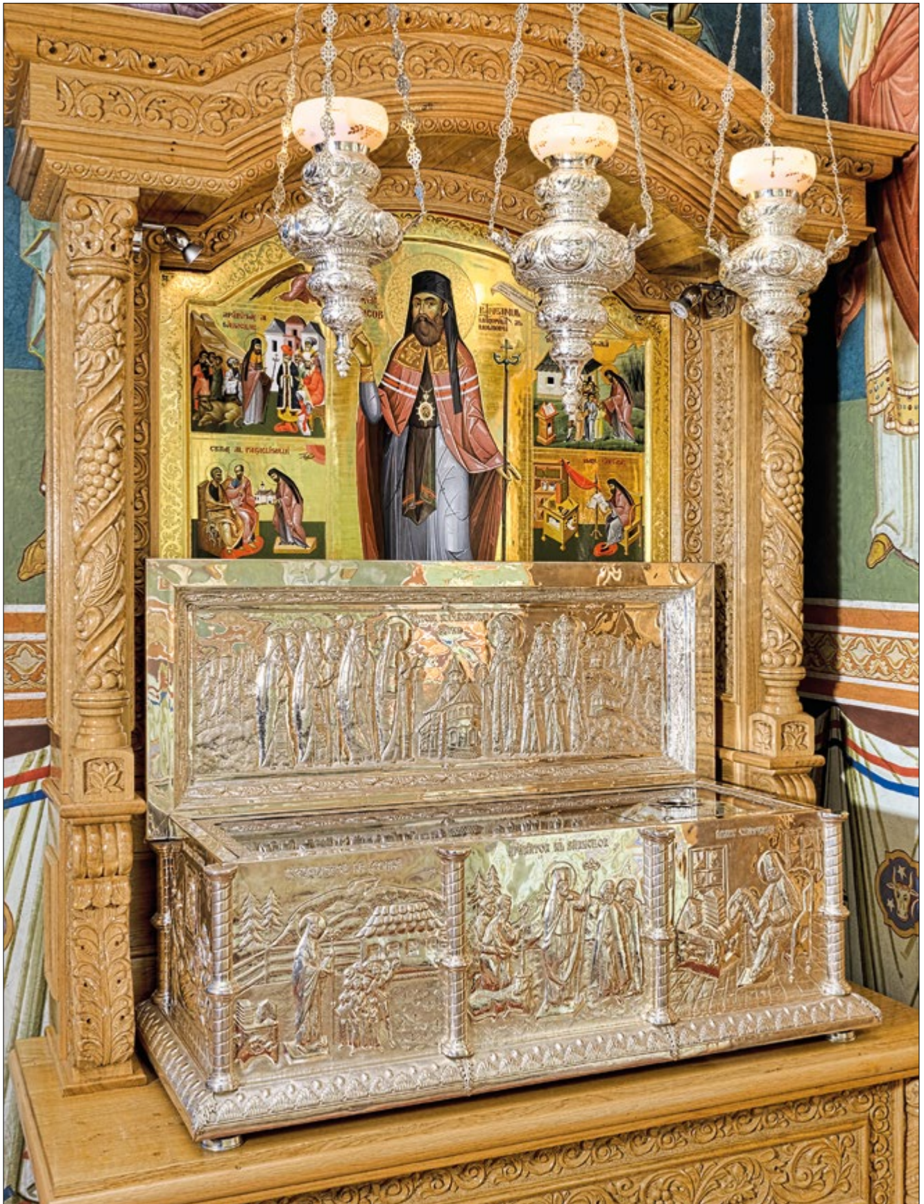
Baldachinul cu racla moaștelor Sfântului Iacob Putneanul din Paraclisul Sfinții Apostoli Petru și Pavel al Mănăstirii Putna