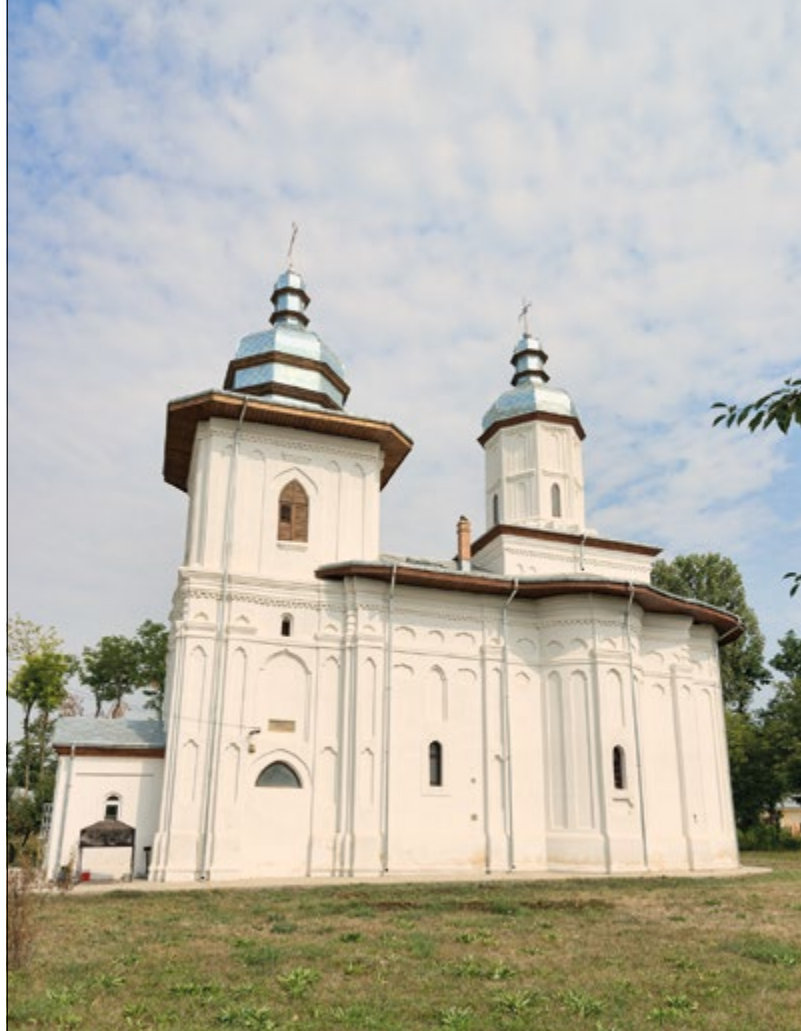
▲ Schitul Doljești din județul Neamț a fost ctitorit de ieromonahul Dionisie Hudici, ucenic al Sfântului Iacob Putneanul, cu binecuvântarea și sprijinul acestuia.

Sfântul Iacob a dorit să arate poporului modele de desăvârșire – sfinții. De aceea, a rânduit să fie traduse Viețile sfinților , adevărate manuale în care orice om, de orice vârstă, fire și statut, își poate afla un model de viață. La îndemnul