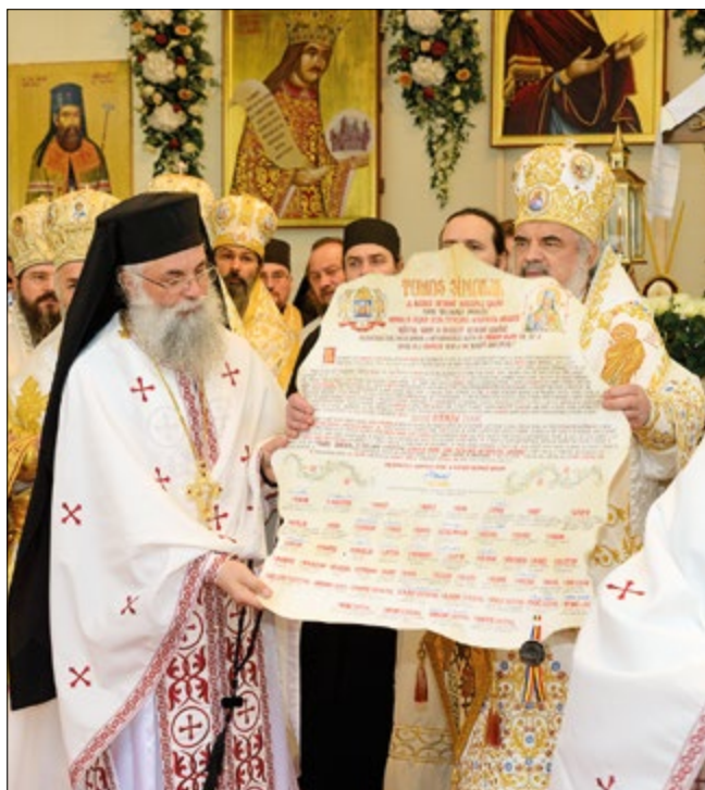
▲ Preafericitul Părinte Daniel, Patriarhul României, prezintă tomosul de canonizare a Sfântului Iacob. Moment din timpul Proclamării solemne a canonizării Sfinților putneni, Mănăstirea Putna, 14 mai 2017.