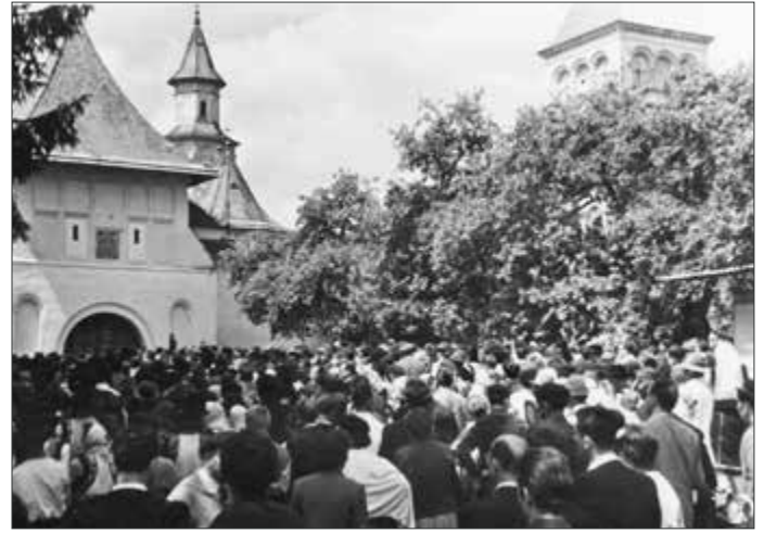
În fața porții mănăstirii, 10 iulie 1966

Al doilea moment a fost în 10 iulie 1966. Au participat zeci de mii de oameni, de data aceasta serbarea fiind mediatizată în toată presa. Autobuze ale ONT cu turiști din regiune și din țară și camioane cu formații artistice s-au îndreptat spre Putna.