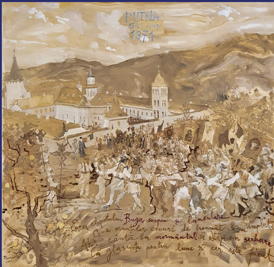
Serbarea de la Putna 1871, Constantin Floridor, 2021