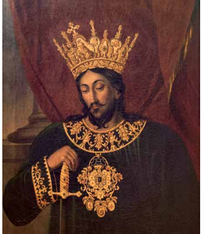
Portret al lui Ștefan cel Mare, sec. al XIX-lea

Serbarea va fi o punte zidită între trecut și viitor: „Pentru asta trebuie să ne-ntrunim, să ne-nțelegem. Și nu poate fi o zi mai aptă pentru această întrunire decât o serbare întru memoria eroului celui mai mare și mai conștient de misiunea sa. Un pelerinaj de pietate către trecut, un congres al inteligențelor, din respect, către viitor, iată, în două cuvinte, scopul serbării noastre”.