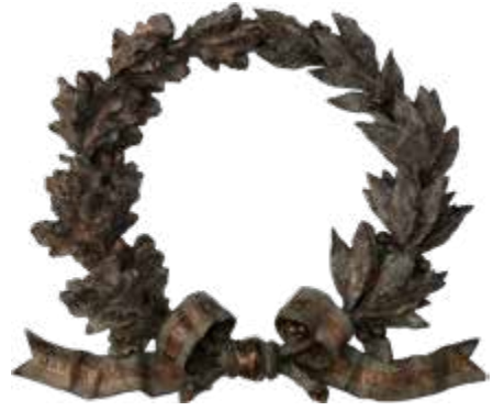
Lauri comemorativi dăruți de Regele Carol I în 1904

Venit-am la acest mormânt ca la un izvor de viață și de virtute, izvor de însuflețire și de îndemn spre fapte patriotice și creștinești. Venit-am pentru ca, preamărindu-l pe el, sufletele noastre să le înălțăm și să le întărim, neamul să ni-l cinstim și țara ce în sânul ei păstrează acest preascump odor. Revarsă lumina ta asupra noastră și asupra neamului tău întreg și spre faptele iubirii de țară, ale iubirii de neam, ale iubirii de credință, virtuți prin care tu strălucești, îndrepată și unește cugetele noastre!