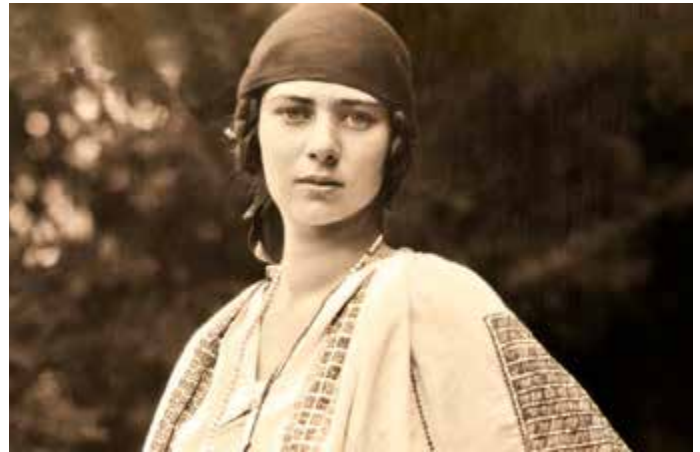
Princesesa Ileana, sub patronajul căreia s-a desfășurat Serbarea de la Putna din 1926

Studenții organizatori au venit la mănăstire cu câteva zile înainte, pentru pregătirile de la fața locului.