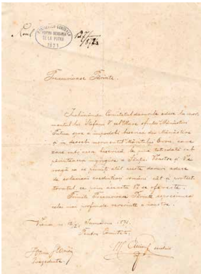
Scrisoare din ianuarie 1871, care a însoțit o parte din darurile trimise de studenți la Putna

Este o întărire a motto-ului Serbării, „Uniți în cugete, uniți în Dumnezeu”, întrucât cine adună cu Dumnezeu, adună cu adevărat, iar cine nu adună cu Dumnezeu, până la urmă va risipi.