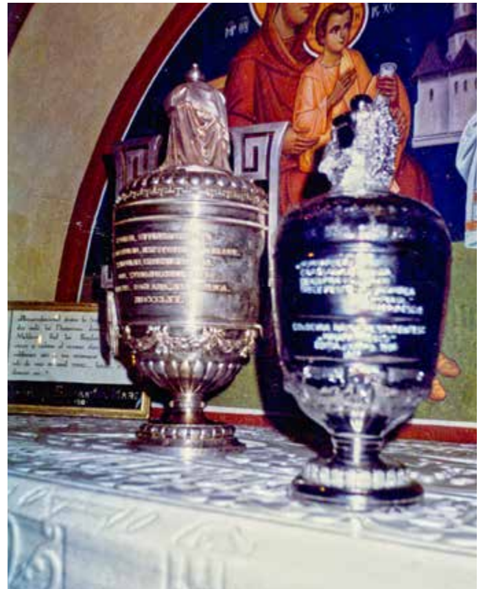
Urnele din 1871 și 1996 pe mormântul Sfântului Ștefan cel Mare

În această urnă s-a pus pământul adus de la mormintele principalilor participanți la serbarea din 1871, de la mormintele lui Lucian Blaga și Alexei Mateevici, Aron Pumnul și Eudoxiu Hurmuzachi, de la Soroca și Zaim, de la Blaj și Alba Iulia. Apoi, noua urnă și cea de la 1871 au fost așezate pe mormântul Sfântului Ștefan cel Mare.