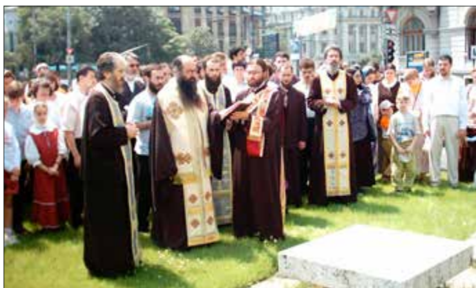
PS Varsanufie Prahoveanul și preoții slujitori de la Biserica Studenților, Piața Universității – București