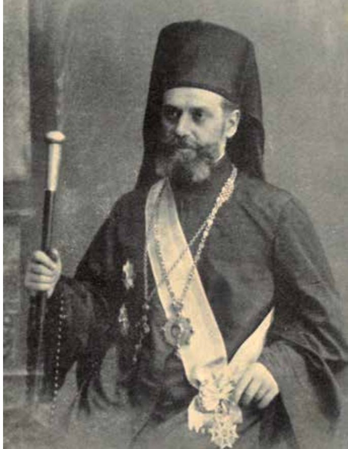
Mitropolitul Nectarie Cotlarciuc

Ceremonia a fost deschisă de 1.000 de buciumași, membri ai societăților arcășești. A urmat cântarea executată de o fanfară militară, pe fundalul căreia Principesa Ileana a luat drapelul tricolor cu care era acoperit bustul lui Eminescu. În continuare, numeroși vorbitori au susținut discursuri, seria acestora fiind încheiată de către Teodosie Popescu.