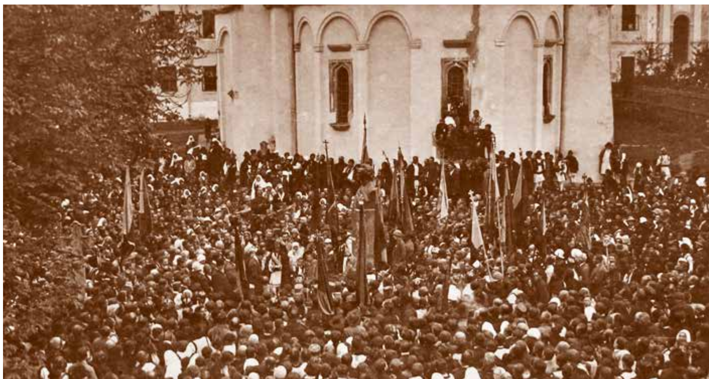
Inaugurarea bustului lui Mihai Eminescu, realizat de Oscar Han

După defilarea societăților arcășești, partea oficială a serbării a fost încheiată.