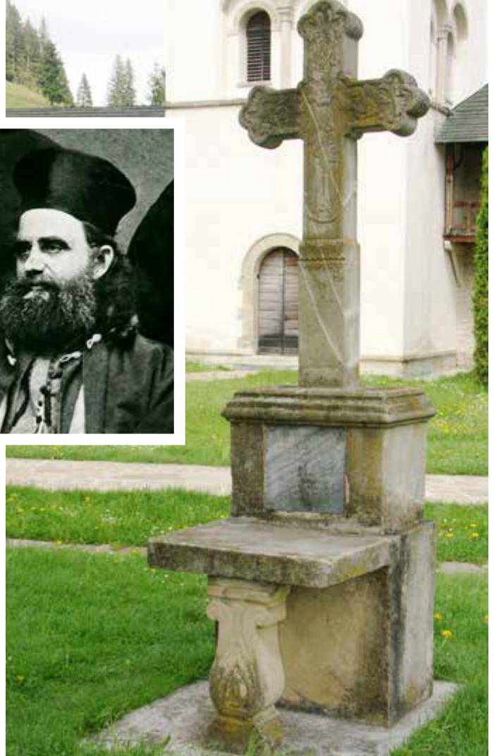
Crucea ridicată în incinta mănăstirii de către starețul Arcadie Ciupercovici după Serbarea din 1871