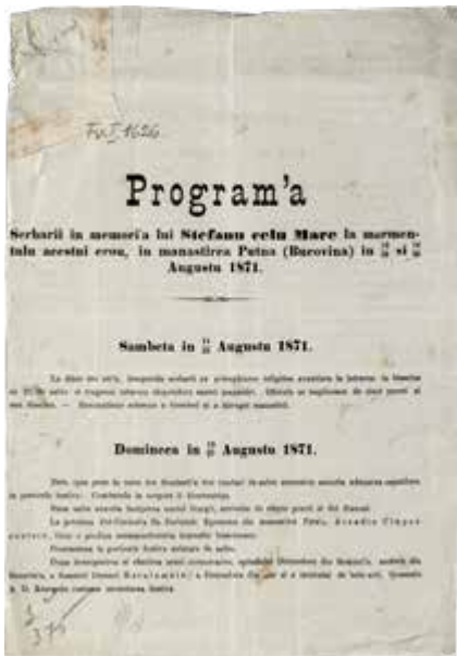
Foaie volantă cu programul Serbării, distribuită participanților

și Țara Românească. Acum, starețul, clericii și călugării de față și membrii Comitetului, aranjați într-o procesiune solemnă, urmați de invitați, au dus darurile în biserică și le-au deșus la mormântul lui Ștefan cel Mare.