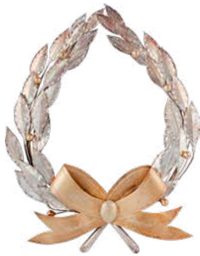
Laurii comemorativi așezați de Societatea „Arboroasa” pe mormântul lui Ștefan cel Mare la Serbarea din 1926

Unirea politică din 1918 nu a adus în mod automat unitatea sufletească și nici siguranța trăinicieii unirii. Cei care au fost conștienți că Marea Unire a fost un dar de la Dumnezeu și o încununare a multor jertfe de veacuri erau preocupați cum să continue edificarea unității. Arma principală era văzută în continuare a fi cultura. Așa cum, în Apelul către tinerele române din 1871, acestea au fost îndemnate să scrie pe flamuri o propoziție despre importanța culturii, în 1927, într-un raport de activitate al Societății academice „Junimea” din Cernăuți, se arăta că tot cultura va fi fundamentală