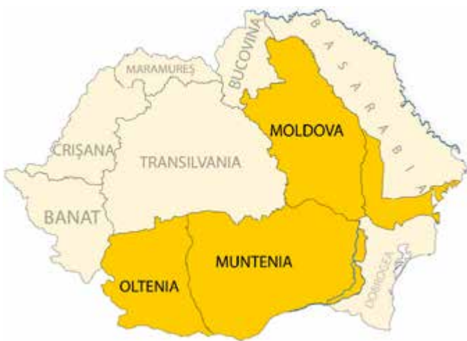
În 1871, România era rezultatul Unirii din 1859, între Țara Românească (fără Dobrogea) și Moldova (fără Bucovina și Basarabia)