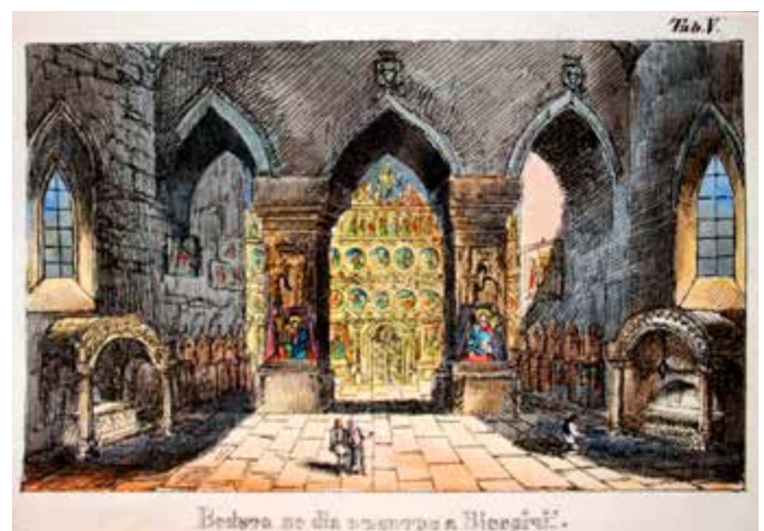
Camera mormintelor, Mănăstirea Putna, 1851