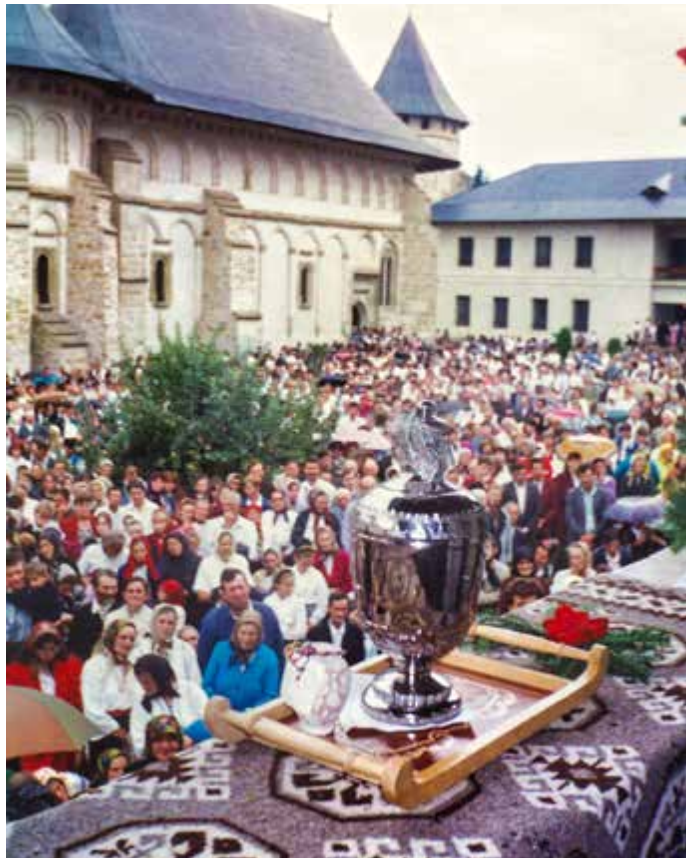
Urna în timpul Sfintei Liturghii, 15 august 1996

Studenții prezenți au depus coroane de stejar la bustul lui Eminescu din incinta mănăstirii și la mormântul Sfântului Ștefan cel Mare.