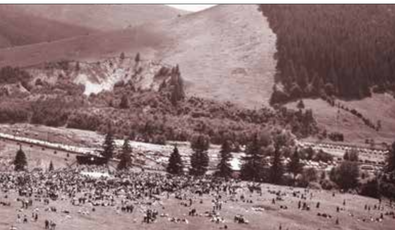
Serbarea câmpenească, 10 iulie 1966