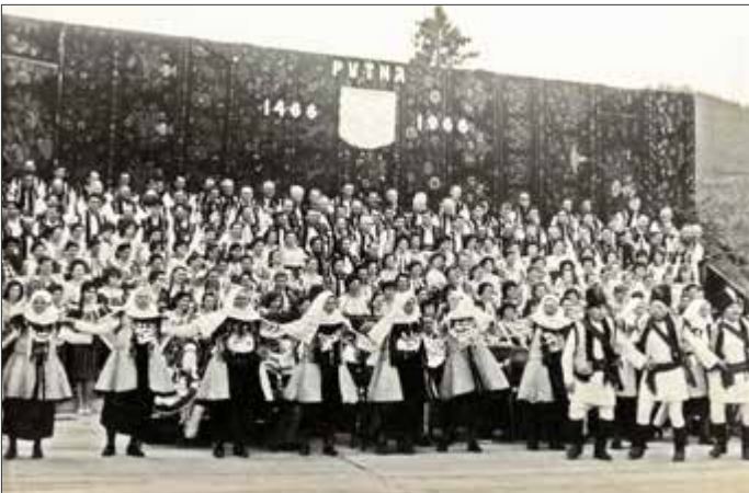
Formațiile corale reunite din zona Rădăuți și dansatorii din Frătăuți, 10 iulie 1966