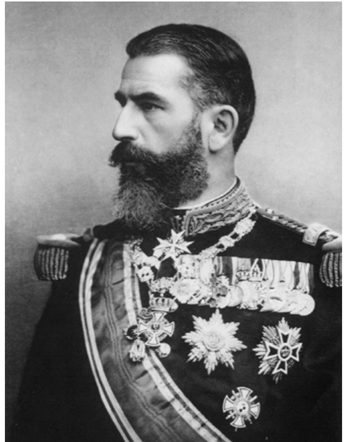
Regele Carol I

În Regat, sufletul amplelor manifestări aniversare a fost Spiru Haret, Ministru al Instrucției Publice și al