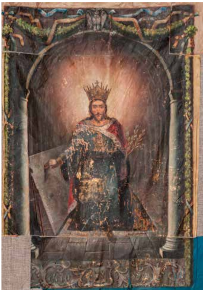
Ștefan cel Mare ieșind din mormânt, pictură aflată în centrul Flamurei tricolore a Școlii „Belle Arte” din Iași. Inscripția „Amor de patrie și lege” unește anul 1470, considerat în epocă ca fiind anul sfințirii mănăstirii, cu anul 1859, cel al Unirii dintre Țara Românească și Moldova

De aceea, meritul nostru va consta numai în formularea ideilor și trebuințelor existente ale poporului, nu în crearea altora. Ne vom lăsa îndreptați de cugetarea și trebuințele poporului nostru, nu de ale noastre proprii,