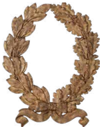
Coroană comemorativă dăruită în 1904 de Liga pentru Unitatea Culturală