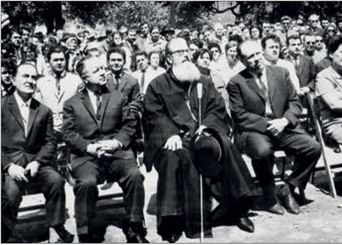
Simpozionul din 10 iulie 1966