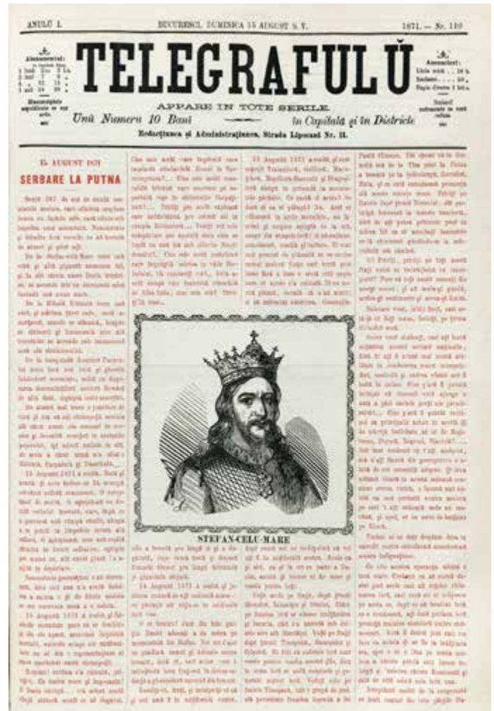
Ziarul „Telegraful” a fost tipărit cu cerneală roșie în 15 august 1871, pentru a marca Serbarea care avea loc la Putna

ceilalți făcând în diferite măsuri aluzii la suferințele românilor sub stăpânire austriacă. Prefectul nu a dat cuvântul unor vorbitori despre care a considerat că vor depăși măsura unei întruniri aprobate de stat. Deși nu au primit aprobare să slujească, unul dintre reprezentanții Mitropoliei Moldovei, episcopul Filaret Scriban, a primit încuviințarea să rostească acum un discurs.