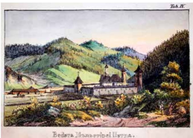
Mănăstirea Putna, 1851

Pentru serbare, trebuia aniversat un eveniment din istoria poporului român care să aibă o asemenea rezonanță, încât să polarizeze în jurul său întreaga națiune. Și evenimentul a fost găsit: împlinirea, în anul 1870, a 400 de ani de la sfințirea Mănăstirii Putna (în sec. XXI, cercetări minuțioase au stabilit că sfințirea mănăstirii a avut loc în 1469). S-a stabilit ca serbarea să aibă loc în data de 15 august, de Adormirea Maicii Domnului, hramul mănăstirii.