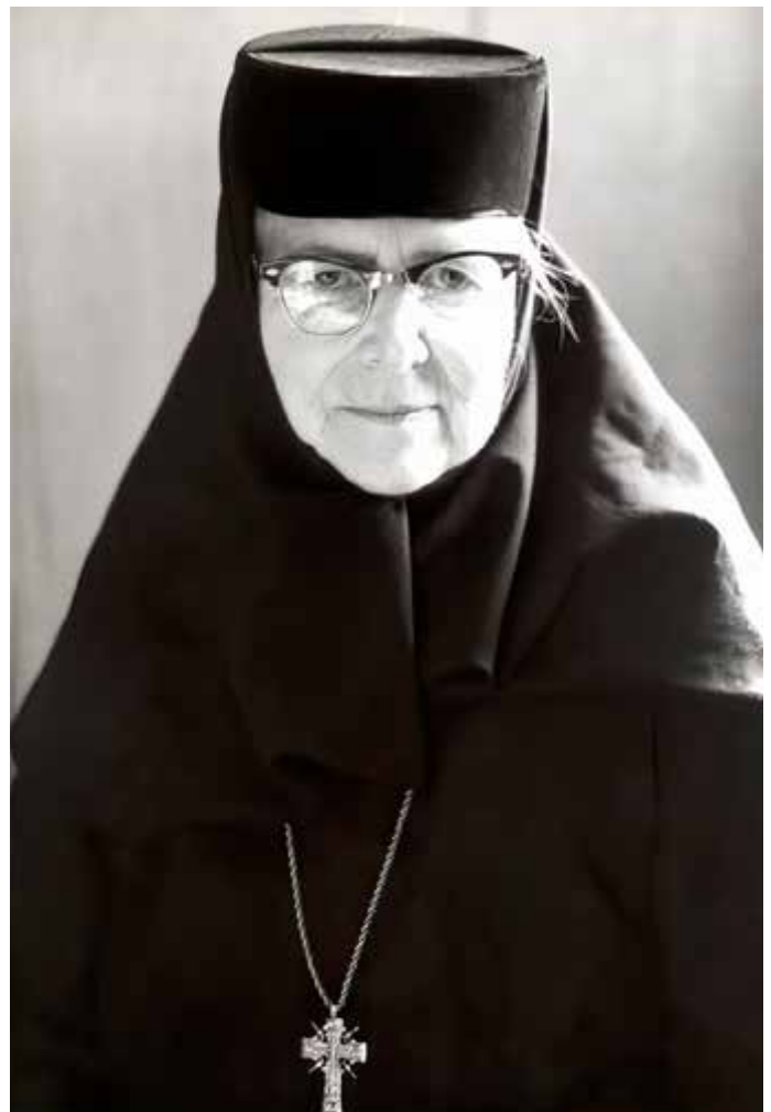
Maica Alexandra, 1991. Princesesa Ileana a intrat în viața monahală în 1961 și s-a călugărit în 1967, primind numele Alexandra. A înființat prima mănăstire ortodoxă de maici, de limbă engleză, din Statele Unite ale Americii

În 8 august, la serbare au fost 5.000–6.000 de participanți. Guvernul a fost reprezentat de Nichifor Crainic, secretar general la Ministerul Cultelor și Artelor.