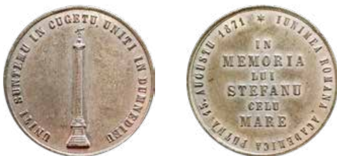
Medalie comemorativă realizată de studenții din asociația „România Jună”

Apropiindu-se momentul serbării și observând că se anunță mulți participanți, în 15 iunie Comitetul face un apel la o nouă strângere de fonduri, accentuând caracterul național al Serbării: „Serbarea de la Putna n-are să fie serbarea unui comitet, nu a unei junimi! Serbarea de la Putna trebuie să fie un act produs de o națiune întreagă! Serbarea de la Putna are să fie întrunirea națiunii române în suvenirile trecutului, în însuflețirea prezentului și în speranțele viitorului! În trecutul neguros al națiunii române sunt multe puncte strălucitoare. Unul dintre acestea, cel mai strălucitor, este acela în care apare umbra măreață a lui Ștefan cel Mare. Pe lângă această suveniră să ne adunăm la mormântul acestui bărbat, să