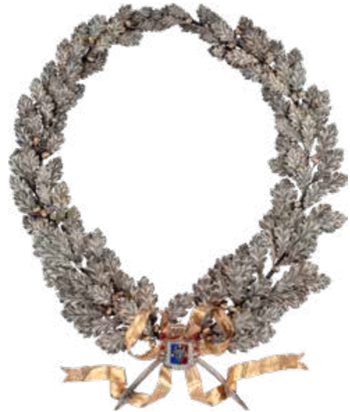
Laurii dăruți de româncele bucovinene. Inscripție: Memoriei eroului Ștefan cel Mare, 1504-1904. Româncele bucovinene