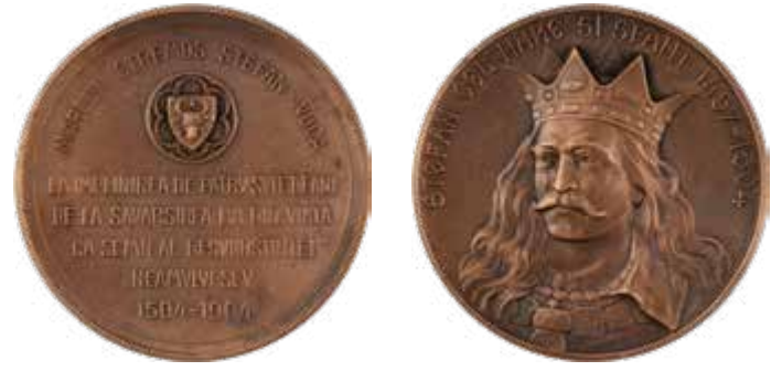
Medalie comemorativă, 1904

Imaginea armoniei dintre români și Imperiul Austro-Ungar nu a fost lăsată nezdruncinată până la