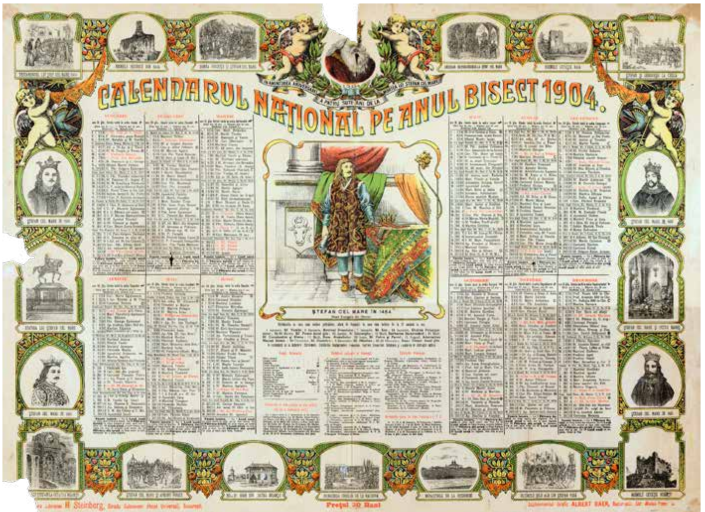
Calendar bisericesc, 1904