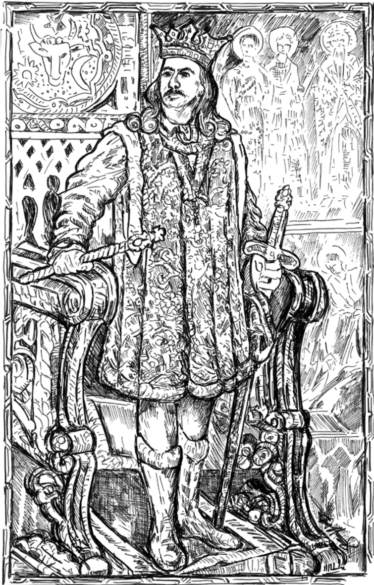
Sfântul Voievod Ștefan cel Mare