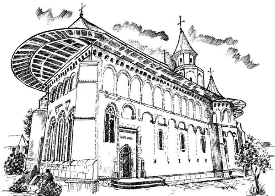
Biserica „Adormirea Maicii Domnului”, Mănăstirea Putna