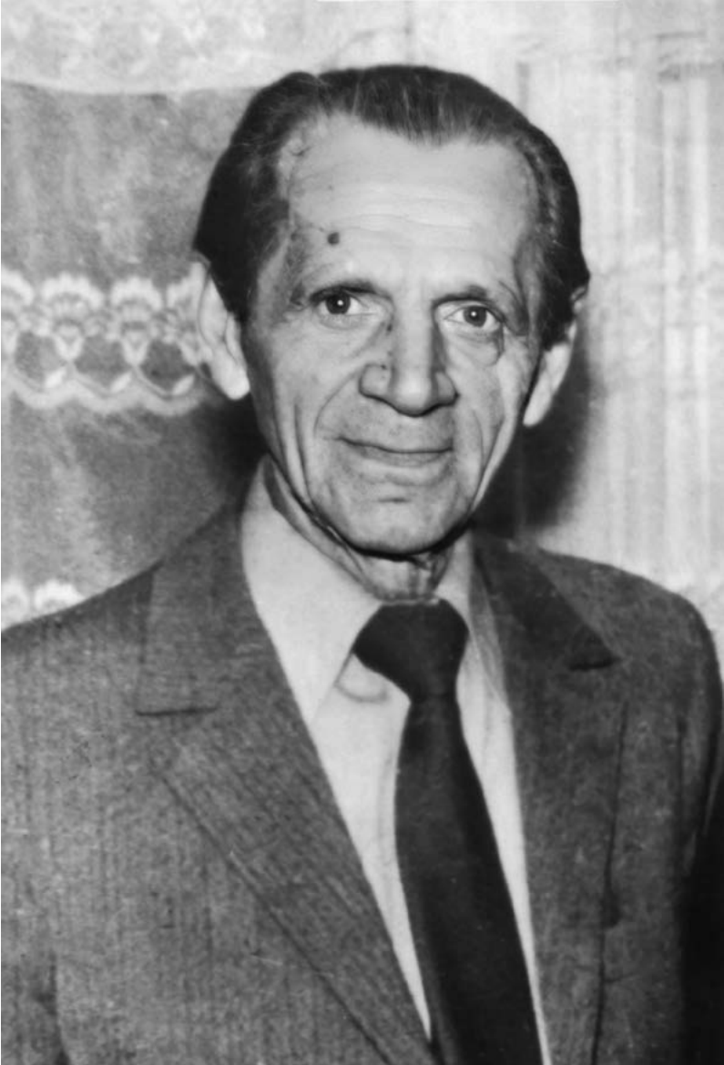
Filip Topa (1908–1987)