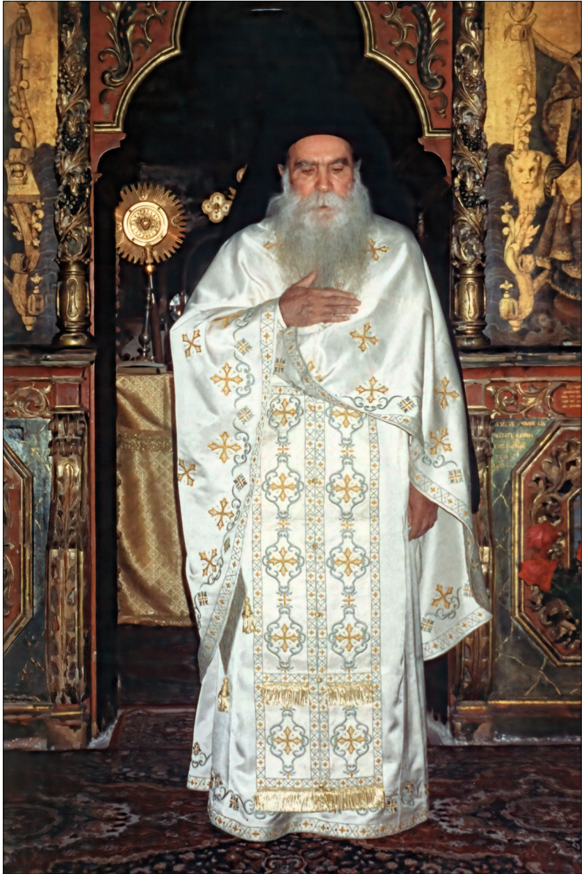
Coliturghisind la ctitoria lui Petru Rareș, Mănăstirea Vatra Moldoviței